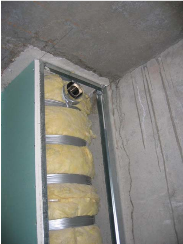
Bild 3. Betonplatte, Mineralwollendämmung, Metallträger, Gipsplattenisolierung

Schornsteinkörper ausgegossen wurden, sowie die ringförmigen Träger 5, die dauerhaft mit den Geschossplatten 4 verbunden werden, übernehmen völlig die mechanische, sowie die durch Hitze verursachte Belastung, die bei der Anwendung auf den Schornsteinkörper wirkt.